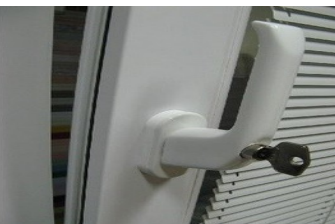
Фиксаторы, ограничители поворота